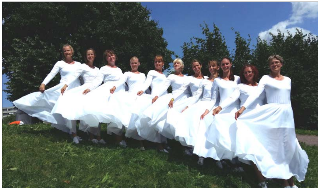
Kärü valla Idla võimlemisrühma naised osalesid Tallinnas toimunud Eestimaa V võimlemispeol Hingelind.