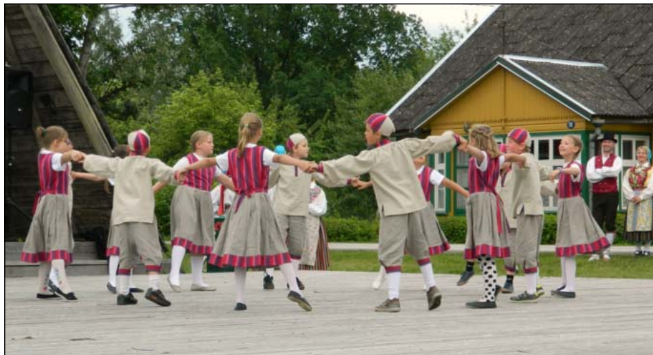
Kooli tantsurühm Väikesed Kärutajad osalesid sel kevadel Rapla maakonna laulu- ja tantsupeol ning tantsisid lustiga ka Kärü jaanipeol.

Peo päev algas aga Tammemäel koos muusikute ja lauljatega ning pidu seati läbimänguga ühtseks. Järgnes lõunasöök maitsva Mamma supi ja mõnusate pannkookidega ja väike puhkehetk ning siis ootas pidulisi juba rongkäik. Sel korral oli rongkäik seatud paika liikide kaupa. Alustati lasteaiast, kes osalesid maakonnapeol esmakordselt, järgnesid algklasside lauljad ja tantsijad ning sealt juba edasi noored ja täiskasvanud. Nii olime pillutatud üle rongkäigu laiali.