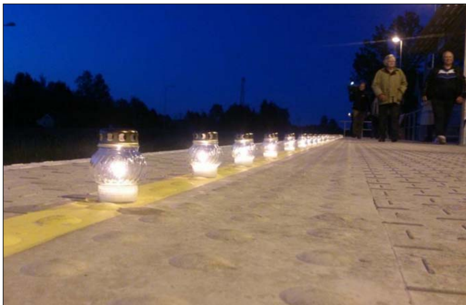
Raudtee veerele ühiselt asetatud küünlad loovad mälestustulede tee läbi Raplamaa juba kolmandat aastat.