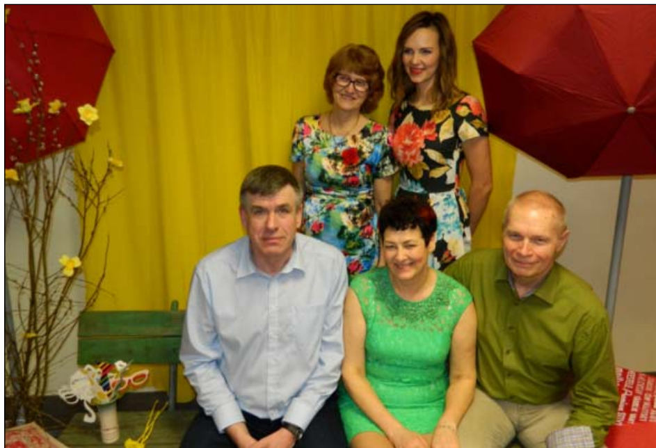
Osa korraldavast laudkonnast Mikud-Mannid, kes täitsid märtsikuu klubiõhtu kevadega.

Lauad on kaetud värviliste kevadist meeleolu rõhutavate linikutega ja korraldaja meeskond on külaliste jaoks valmistanud maitsvaid suppeid ja roogasid. Üsna võõras on mulle vaatepilt, et kõik külalised on planeeritud alguseks kohal ja ootusärevalt ootavad avakõnet korraldajalt.